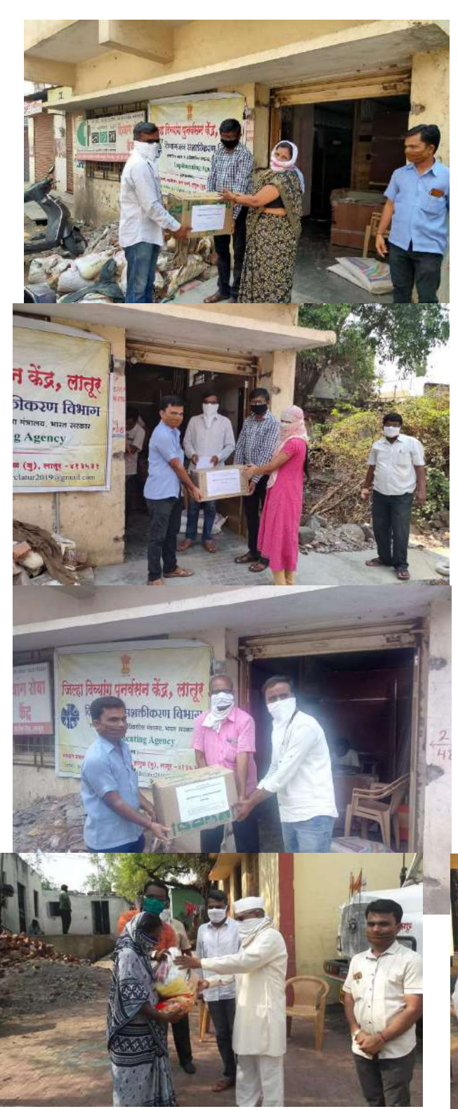
During Corona Period Distribution of Ration Kits to Divyang Family.