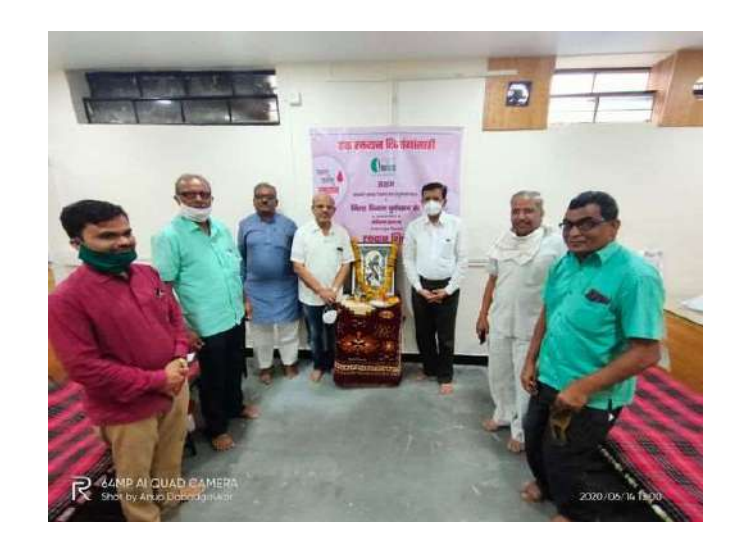
Date - 14^{\rm th} June 2020 - Blood Donation Camp for Divyangjan