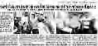
अमरपुर के निवेदितपुर से ट्रेन में बैठकर अमरपुर पहुंचेगा मधुसूदन का सुपुत्र

शहर के 2500 सहित प्रदेश के 15 लाख दिव्यांगों को बस किराये में यूपीआईडी कार्ड से मिलेगी 50 फीसदी तक छूट। उन्होंने कहा कि हमें नकारात्मक शब्दों का प्रयोग बंद करना होगा और हमें एक-दूसरे की मदद करनी होगी।