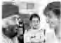
बौद्धिक दिव्यांग बच्चे, फिरोजपुर

फिरोजपुर में कुछ बच्चों के लिए एक छोटी सी संस्था है, जहाँ बच्चों को शिक्षा दी जाती है। इस संस्था के नाम पर 'संस्था स्नेह' है। इस संस्था के माध्यम से बच्चों को शिक्षा दी जाती है। इस संस्था के माध्यम से बच्चों को शिक्षा दी जाती है।