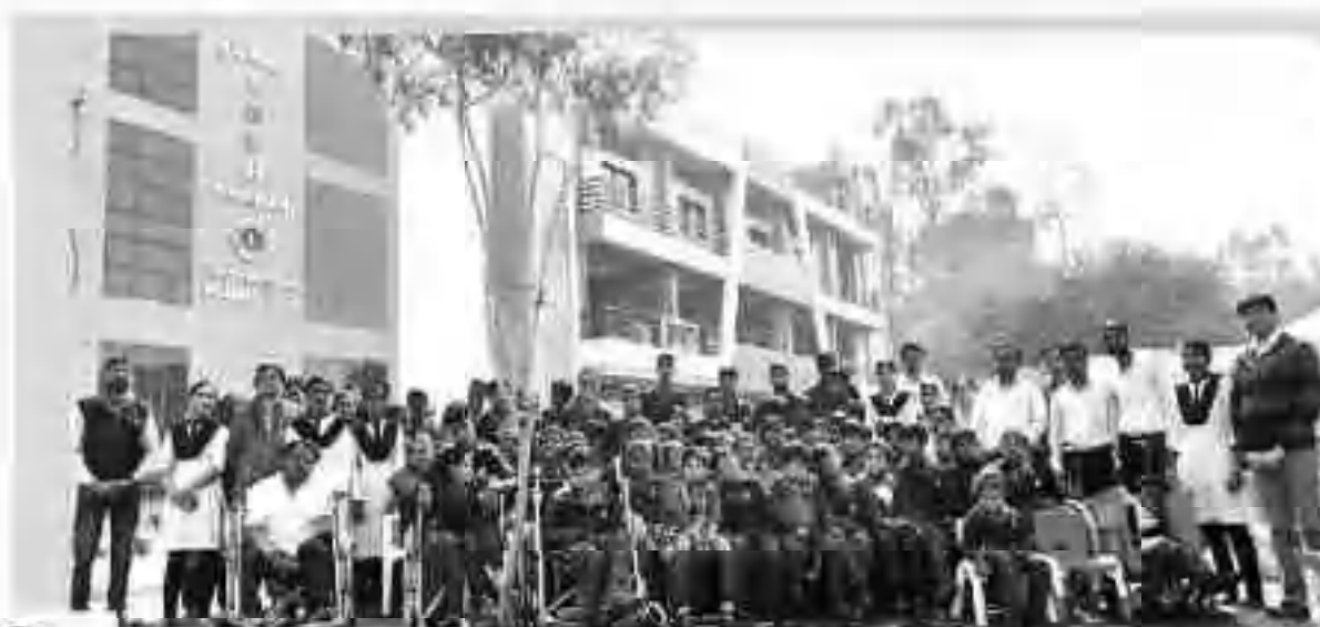
संघ के प्यारे बच्चों के साथ यादगार पल