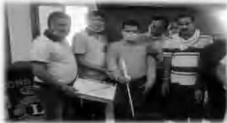
दिव्यांगजन को स्मार्ट केन वितरित करते हुए लायंस ऑफ़ नागदा के सदाधिकारिण