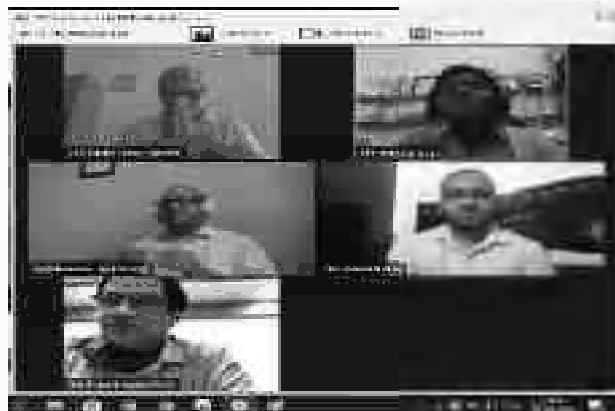
03 जून 2020 को आयोजित राज्य स्तरीय ऑनलाइन वेबिनार