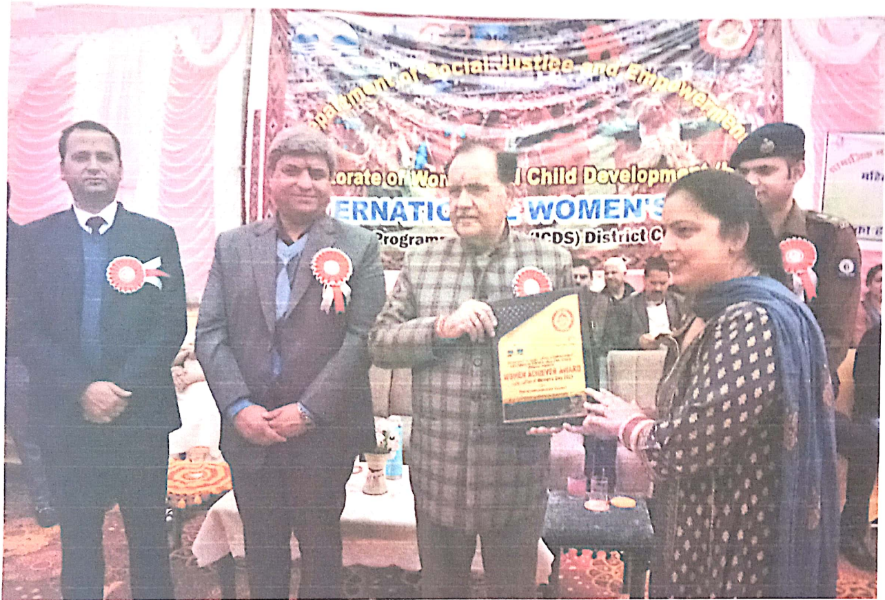
Award By Deputy Commissioner Chamba